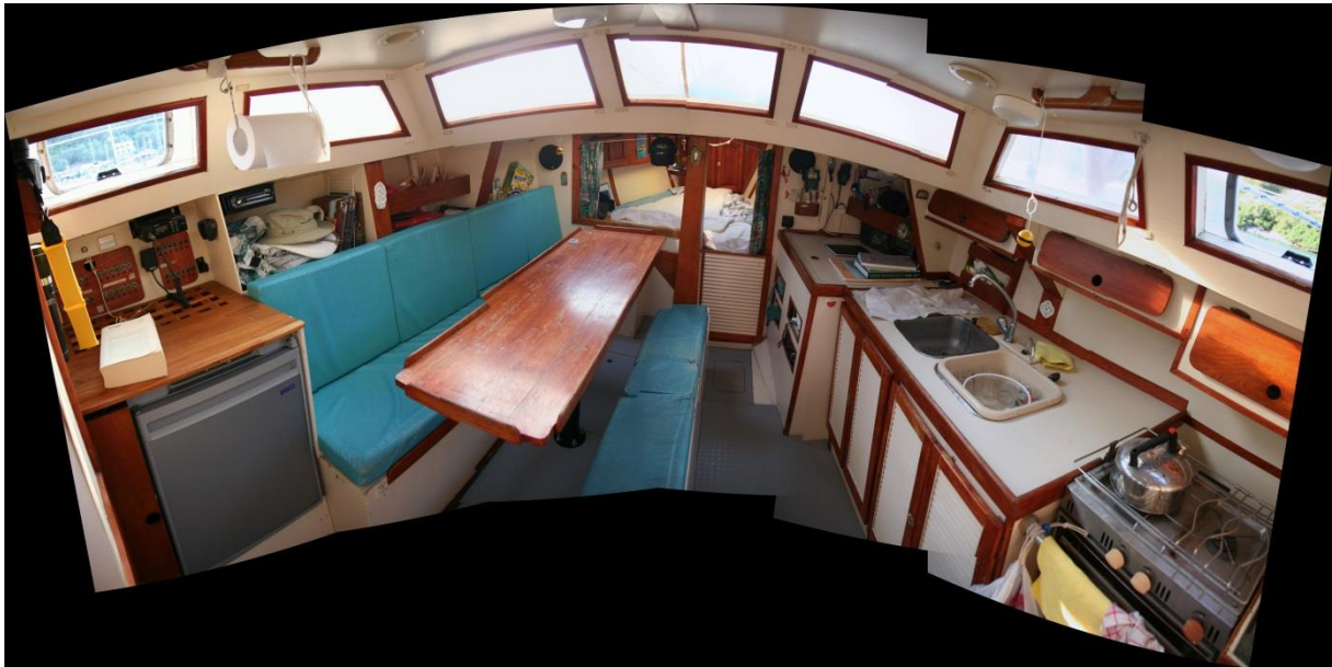
Photo panoramique de Cumulus prise de la descente : à bâbord le frigo, avec au-dessus la VHF et le tableau électrique, puis le carré (transformable en couchette double), avec le lecteur CD, USB et radio ; à l'avant la couchette double ; à tribord la table à cartes avec GPS et connectique pour un PC avec OPENCPN, puis la cuisine avec deux éviers, le réchaud et de nombreux rangements.