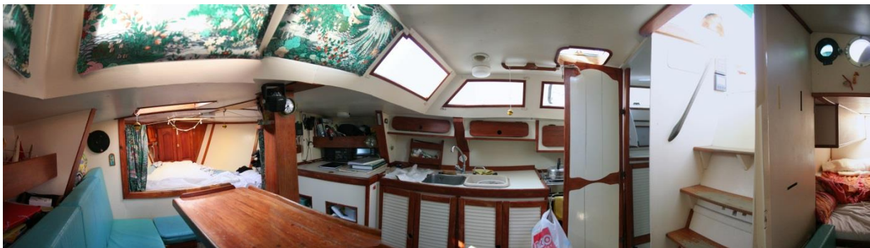
Photo panoramique de Cumulus prise de la banquette bâbord : de la gauche vers la droite, on voit la banquette bâbord, la cabine avant, la table à carte, la cuisine avec son évier et le réchaud, les toilettes, la descente et (un peu) la cabine arrière.

Photo panoramique de Cumulus prise de la descente : à bâbord le frigo, avec au-dessus la VHF et le tableau électrique, puis le carré (transformable en couchette double), avec le lecteur CD, USB et radio ; à l'avant la couchette double ; à tribord la table à cartes avec GPS et connectique pour un PC avec OPENCPN, puis la cuisine avec deux éviers, le réchaud et de nombreux rangements.