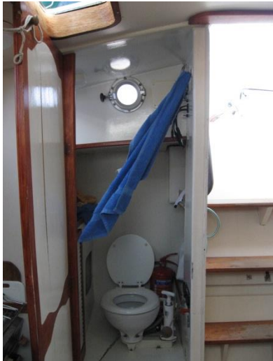
Le cabinet de toilette.