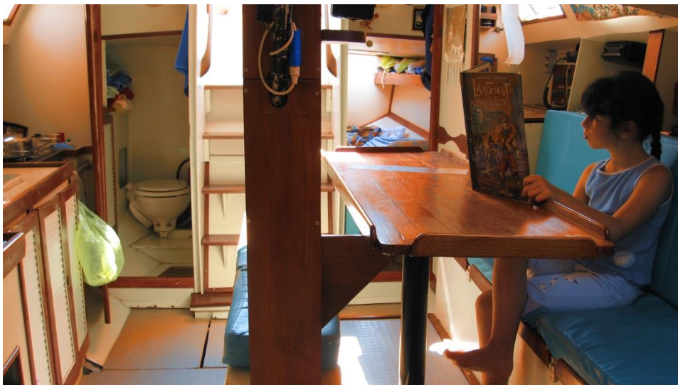
Photo prise de la cabine avant vers l'arrière ; De la gauche vers la droite : La cuisine, les toilettes (lavabo, placard à cirés, toilette) la descente et le banc central avec rangements sur puits de dérive, la cabine arrière, la table et la banquette.