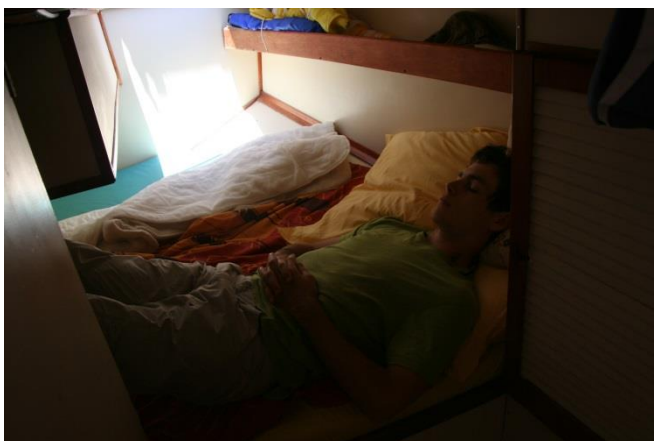
La cabine arrière avec son placard à droite, et au fond le grand hublot.